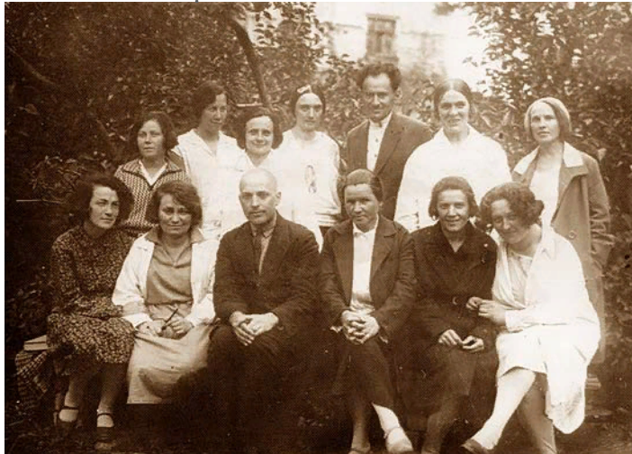
Экспериментальный дефектологический институт Наркомпроса (ЭДИ)