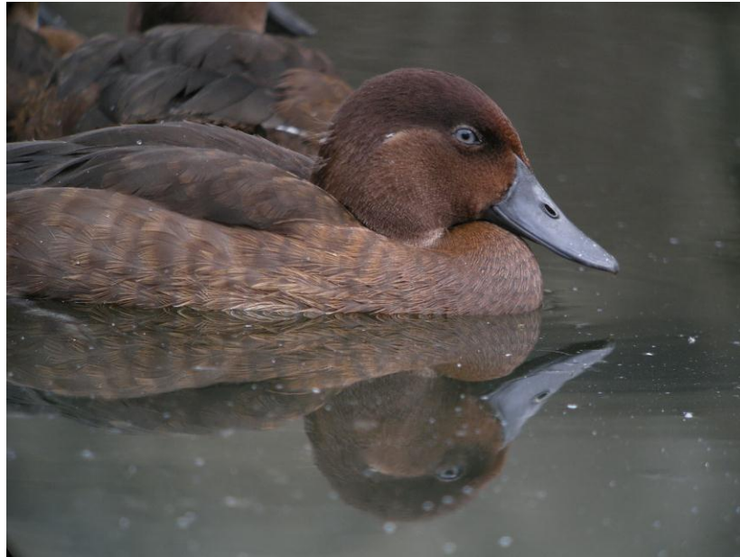
Мадагаскарский нырок ( Aythya innotata )