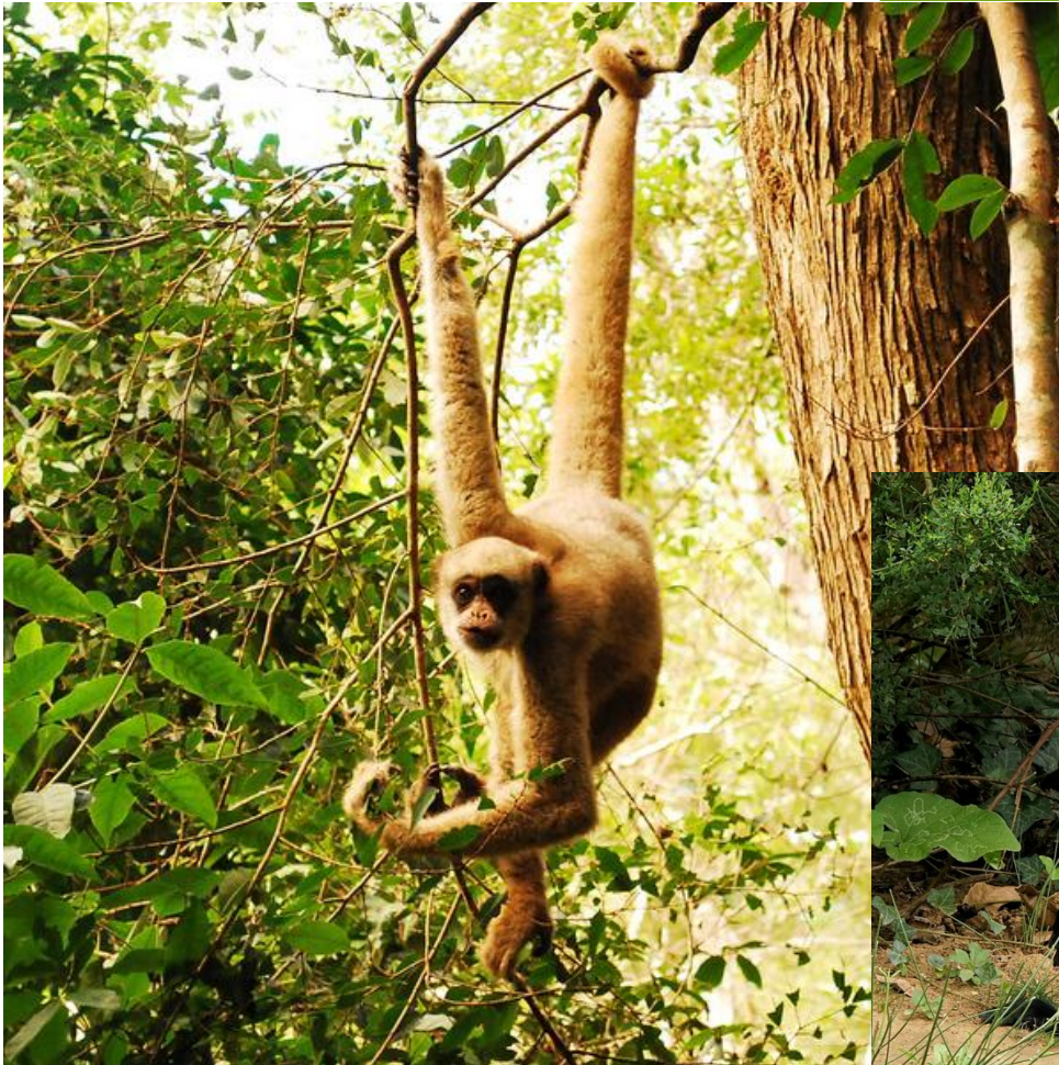
Рыжеватая обезьяна ( Brachyteles hypoxanthus )