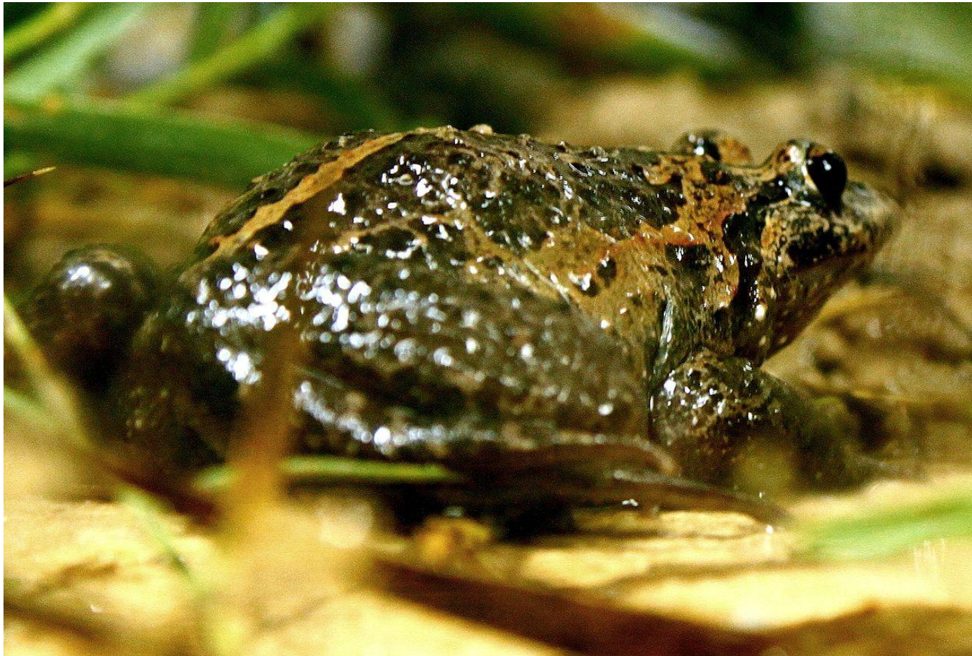
Чернобрюхая дискоточная лягушка ( Discoglossus nigriventer )