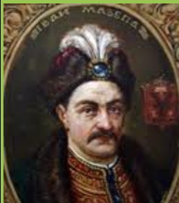
Иван Степанович Мазепа