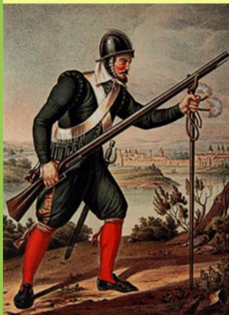
Мушкетер из полка «нового» (иноземного) строя

Во 2-й половине XVII в. в России появились полки «нового (иноземного) строя»: пешие (солдатские или мушкетерские) и конные (рейтарские).