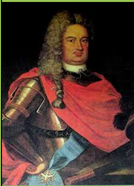
Борис Петрович Шереметев