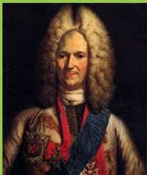
Александр Данилович Менишков